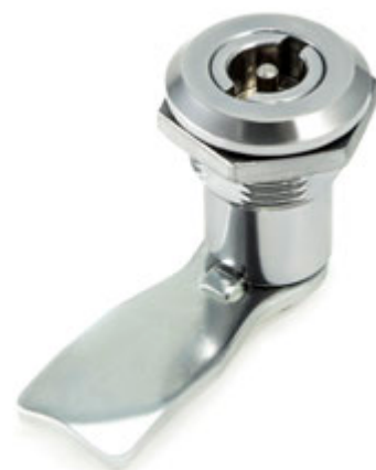
Размеры посадочного отверстия Тип А