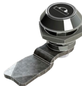
Размеры посадочного отверстия